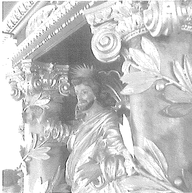
Abb. 13: Kirche in Schloß Ricklingen · Kopf des Christus im Kanzelaltar, 1994

„...Unter diesen Umständen gebietet die Noth-