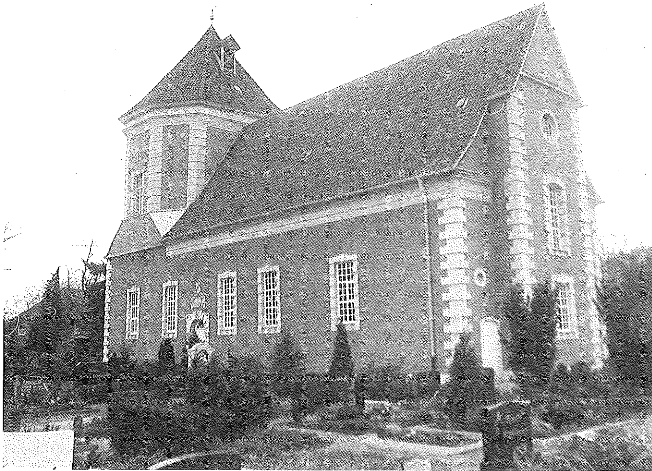
Abb. 12: Kirche in Schloß Ricklingen · von Südosten, 1994