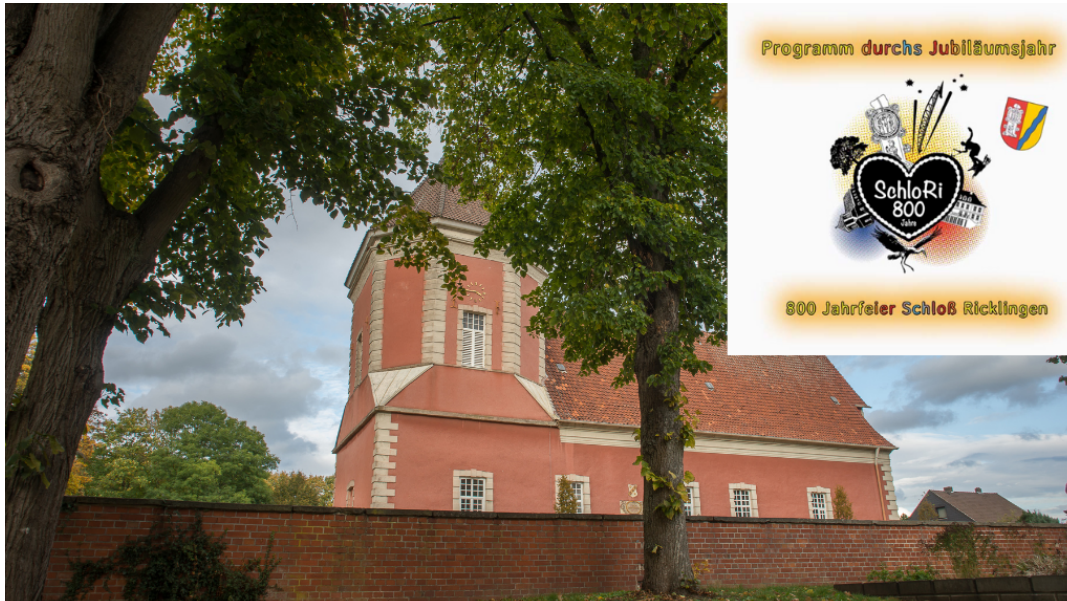
Die 800 Jahrfeier steht vor der Tür/GCN